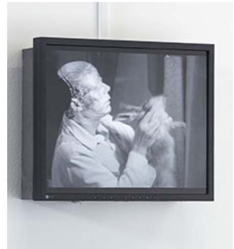
Coyote: I like America and America Likes Me © Joseph Beuys

Också Henrik Håkansson har intresserat sig för ljuden i djurens samspel och byggt upp miljöer för att studera olika djurs behov av egna världar. Nu visar han målningar efter en måltid: getingar har fått knapra på ytor som konstnären täckt med sockerlösning och giftfri färg. Mönstret i målningen speglar i slutändan ett estetiskt-naturvetenskapligt kunskapande. Rester, flagor i vitt, som enligt målningens underrubrik anknyter till den amerikanske konstnären Robert Ryman, en av dessa "vitmålare" som sökte reduktion och tomhet i den vita färgen.