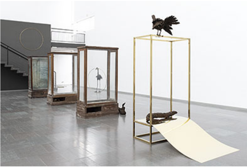
Installationsvy © Petrit Halilaj