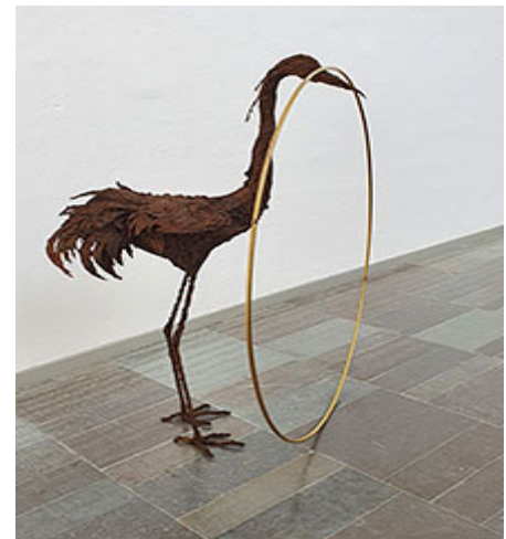
Poisoned by men in need of some love (grus antigone) © Petrit Halilaj

Nyfikenheten på och närheten till djurens varseblivning har drivit Kristina