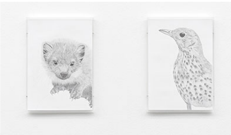
Ur A table full of strangers (The end of cosmic loneliness) © Kristina Buch

Att museisamlingar med uppstoppade djur kan användas i nationsbyggande och identitetsstärkande syfte driver Petrit Halilajs stora installation. Han har hämtat fram slitna, tomma och undanställda vitriner ur det nerlagda naturhistoriska museets källare i Kosovos huvudstad Pristina, och stoppat upp några djur med en blandning av jord och gödsel, laddade material för både förgänglighet och hemmahörighet, symboler för ära och förnedring. Utan den utförliga förhistorien och utan förklaringar i ord ger dock installationen ett ganska magert intryck.