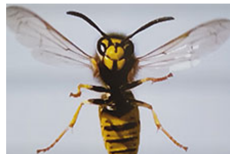
Sep.2, 2021 Vespa crabo . Stillbild ur videofilm ©