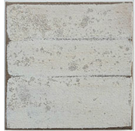
Aug 12 (After Robert Ryman, Untitled, 1965)