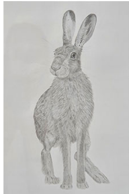
Ur A table full of strangers (The end of cosmic loneliness) © Kristina Buch

I panterns pupill är rubriken för Lunds konsthalls utställning. Här sammanförs parallella världar genom inblick i sju olika konstnärskap från världen över. De förenas genom ett slags gränsöverskridande forskning där flera discipliner länkas samman, samtidigt som både metod och resultat visualiseras med konstnärlig och poetisk uppfinningsrikedom. Det är kanske inte alltid som högkvalitativa formuleringar parerar angelägna budskap. Men de är drabbande, överraskande, egensinniga eller högst traditionella och därtill laddade med fördjupat engagemang, utan att förvandlas till aktivism. Insikten om antropocenerans skadeverkningar för allt levande på jorden och dess framtid är snarare mer än mindre manifestativt formulerad.